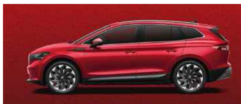
VELVET RED SPECIĀLĀ KRĀSA 1 200 €