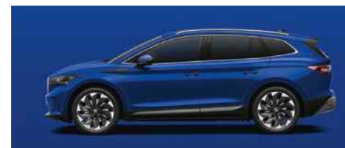
ENERGY-BLUE STANDARTA KRĀSA 0 €