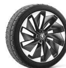
21" SUPERNOVA antracīta metālika 1 580 €