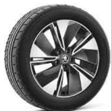
19" REGULUS antracīta metālika 210 €