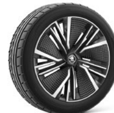
20" NEPTUNE AERO disku uzlikas 920 €