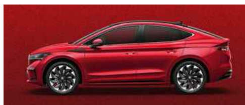
VELVET RED SPECIĀLĀ KRĀSA 1 200 €