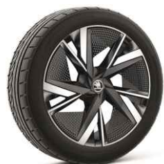
20" TAURUS 810 €