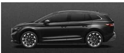
BLACK MAGIC PEARLESCENT METĀLISKA KRĀSA 730 €