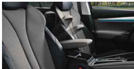
DIZAINA PAKETE "LOFT"