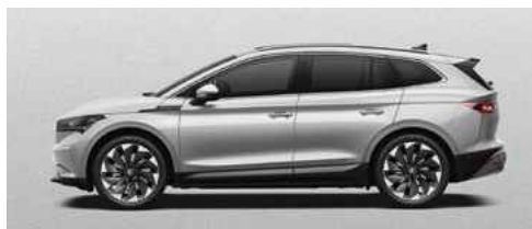
BRILLIANT SILVER METĀLISKA KRĀSA 730 €