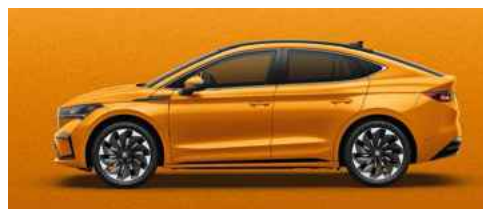
PHOENIX ORANGE METĀLISKA KRĀSA 730 €