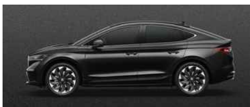
BLACK MAGIC PEARLESCENT METĀLISKA KRĀSA 730 €