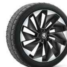
21" SUPERNOVA melna metālika 1 580 €