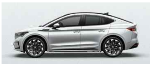
MOON WHITE METĀLISKA KRĀSA 730 €