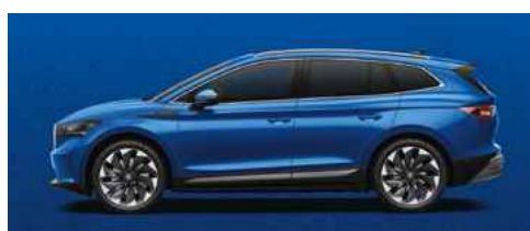
RACE BLUE METĀLISKA KRĀSA 730 €