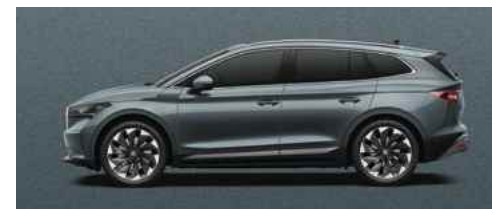
GRAPHITE GREY METĀLISKA KRĀSA 730 €