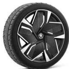
21" VISION AERO disku uzlikas 770 €