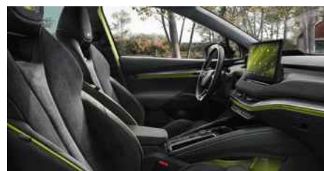
DIZAINA PAKETE "RS LOUNGE"