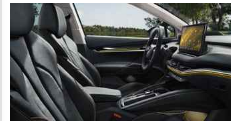
DIZAINA PAKETE "SUITE BLACK"