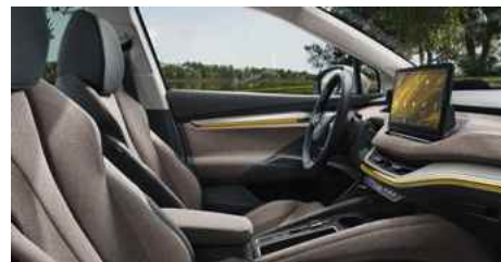
DIZAINA PAKETE "LODGE"