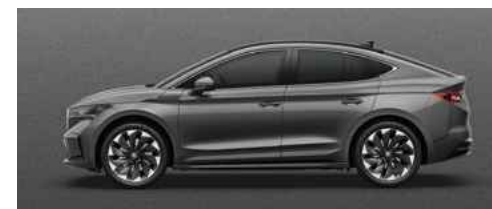
GRAPHITE GREY METĀLISKA KRĀSA 730 €