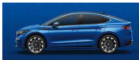
RACE BLUE METĀLISKA KRĀSA 730 €