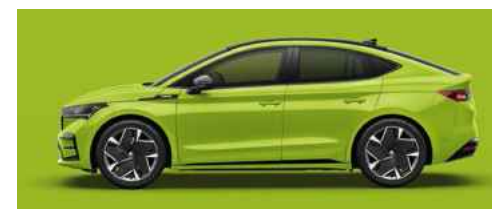
MAMBA GREEN STANDARTA KRĀSA 470 € (tikai RS)