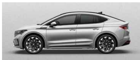
BRILLIANT SILVER METĀLISKA KRĀSA 730 €