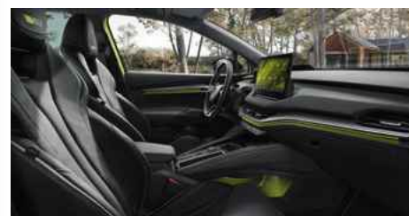
DIZAINA PAKETE "RS SUITE"