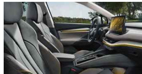
DIZAINA PAKETE "LOUNGE"