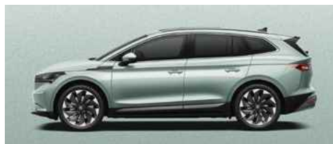
ARCTIC SILVER METĀLISKA KRĀSA 730 €