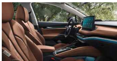
DIZAINA PAKETE "ECO SUITE"