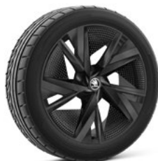
20" TAURUS BLACK AERO disku uzlikas