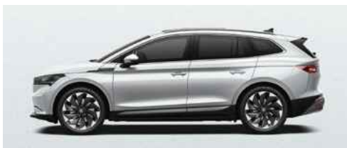
MOON WHITE METĀLISKA KRĀSA 730 €