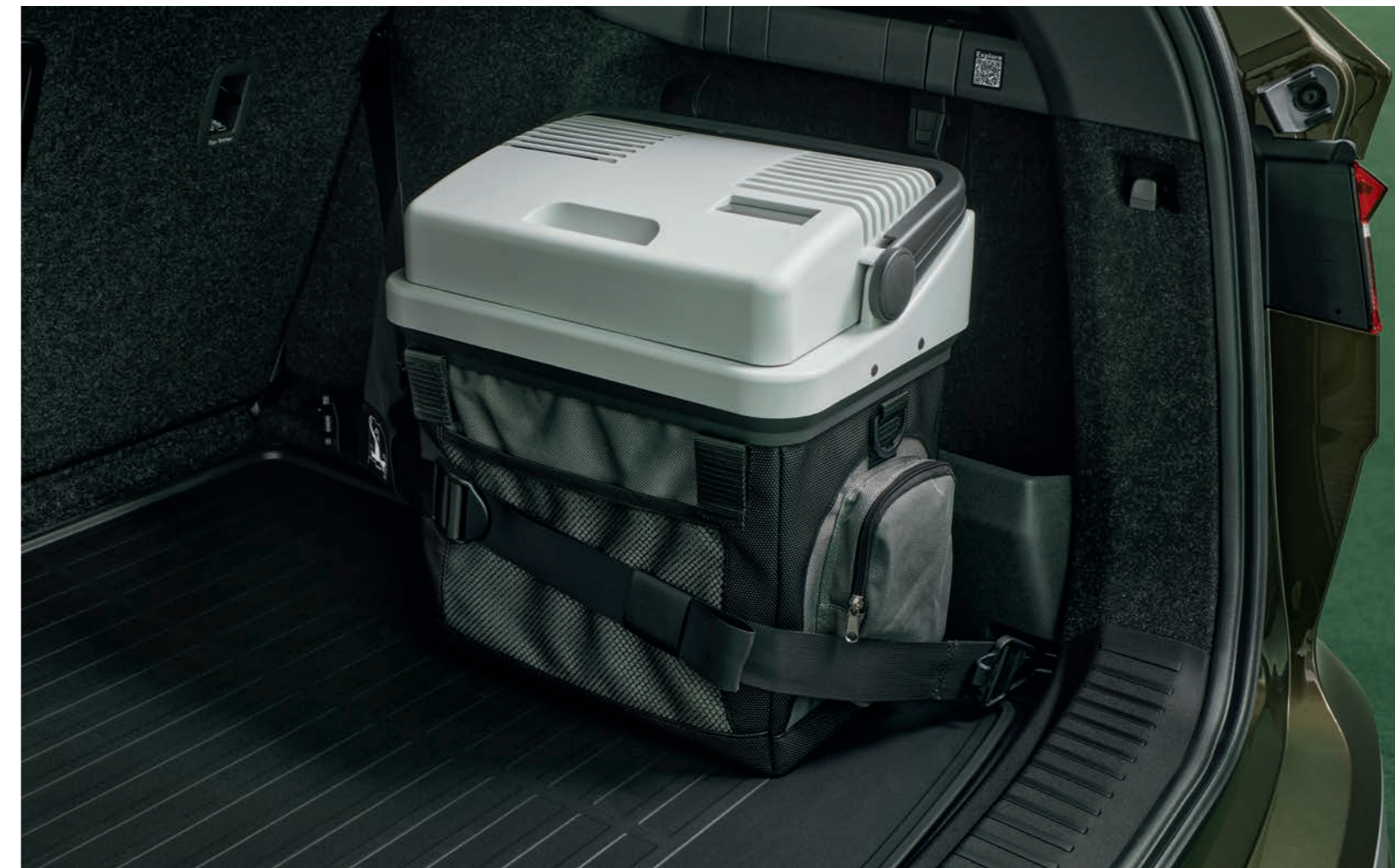
Bagāžas nodalījuma stiprinājuma sikсна

Plašs bagāžas nodalījums ir vēl noderīgāks, ja bagāža tajā ir rūpīgi sakārtota. Ielieciet uzlādes kabelus tiem paredzētajā somiņā un nostipriniet bagāžu ar stiprinājuma siksnām vai elementiem. Jūs pat varat ielikt ēdienus un dzērienus termoelektriskajā dzesēšanas kastē.