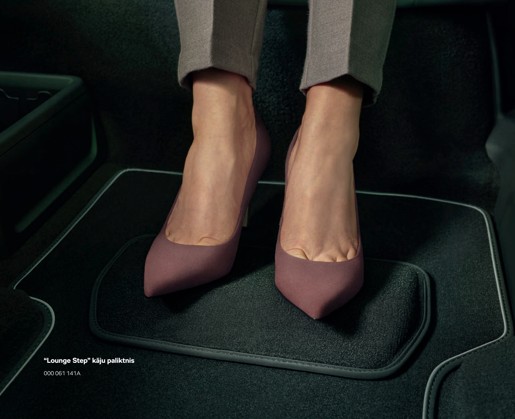
“Lounge Step” kāju paliktnis