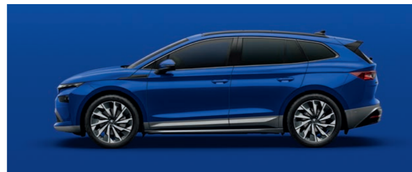
Energy Blue nemetālika