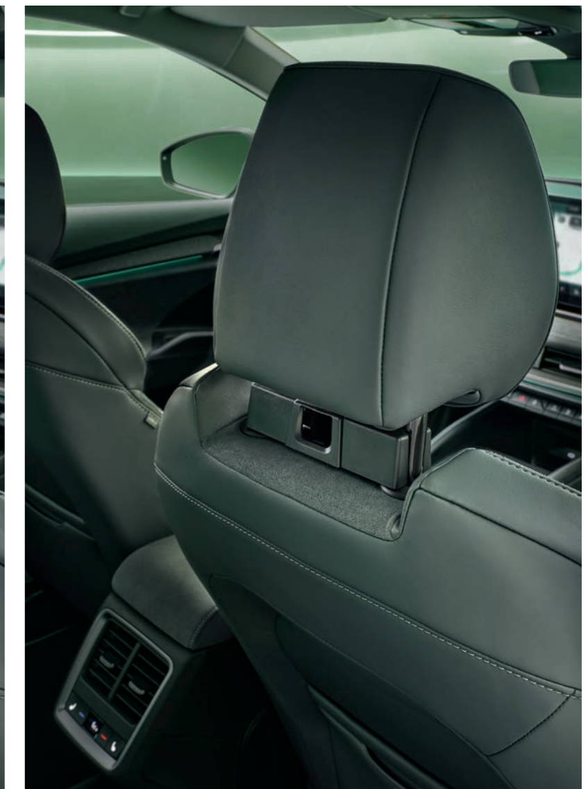
Viedais turētājs — adapters

3V0 061 128 | standarta sēdekļi 5E3 861 221 | sporta sēdekļi