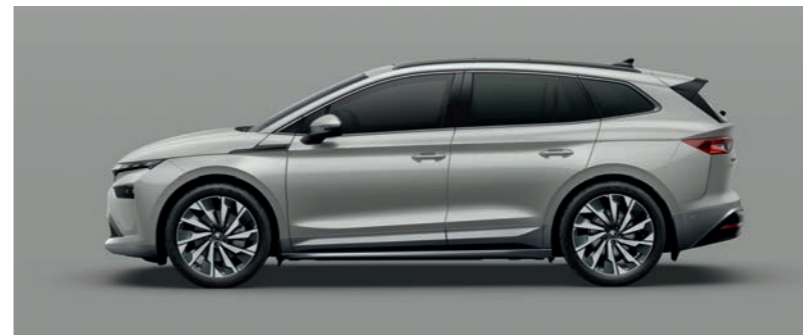
Steel Grey nemetālika