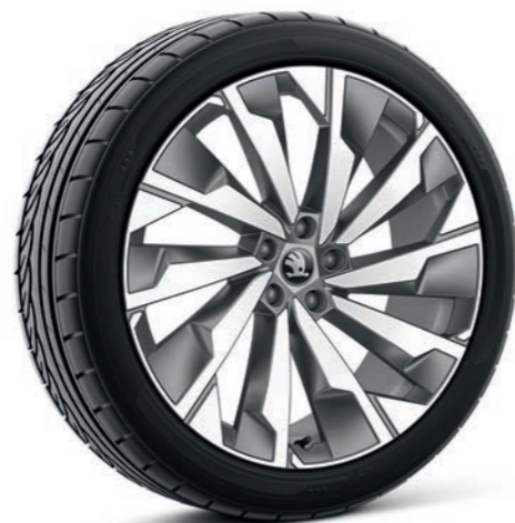
21" Supernova antracīta vieglmetāla diski