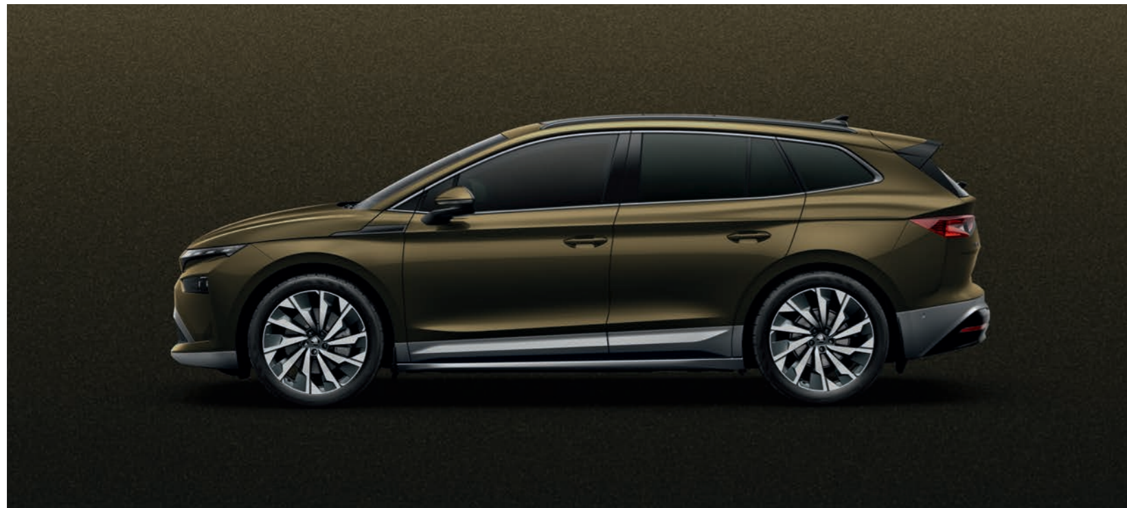
Olibo Green metālika