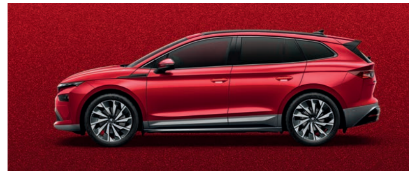
Velvet Red metālika