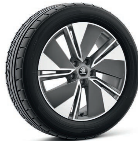
19" Regulus antracīta vieglmetāla diski