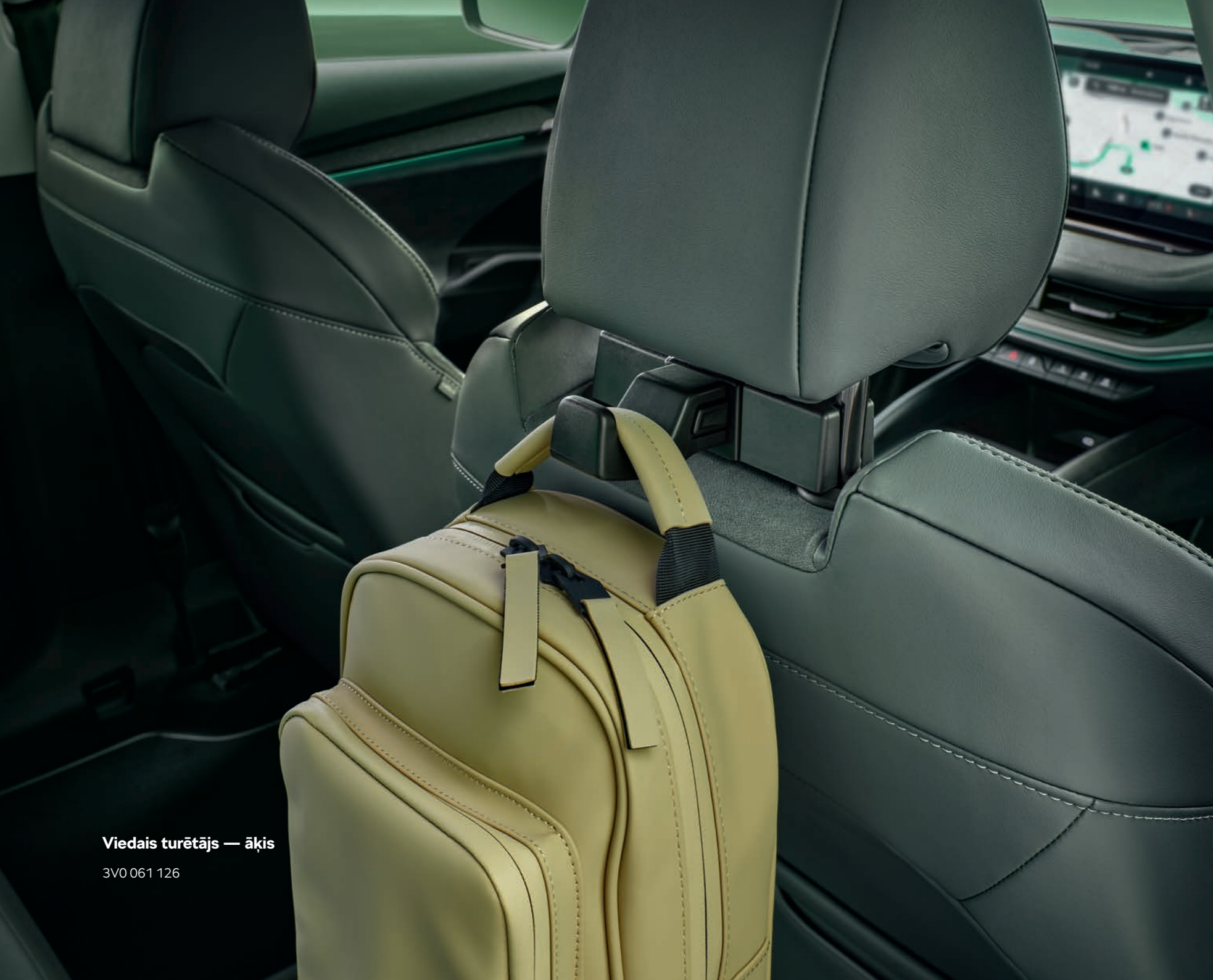
Viedais turētājs — āķis