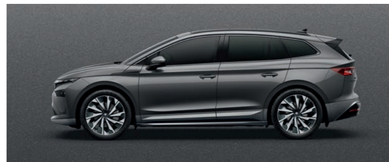
Graphite Grey metālika