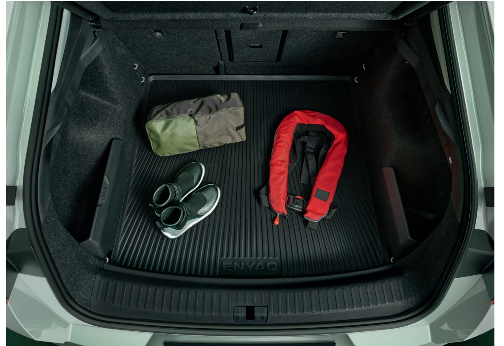
Bagāžas nodalījuma aizsargpārklājs