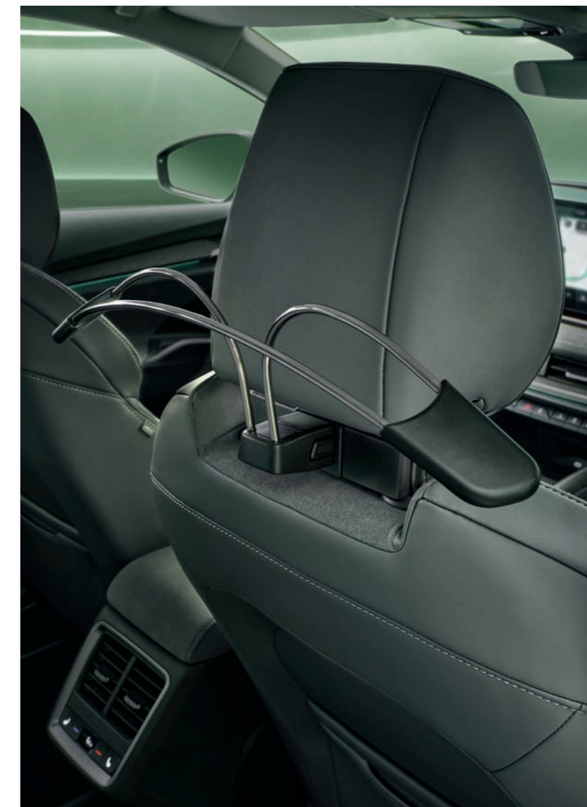
Viedais turētājs — pakaramais