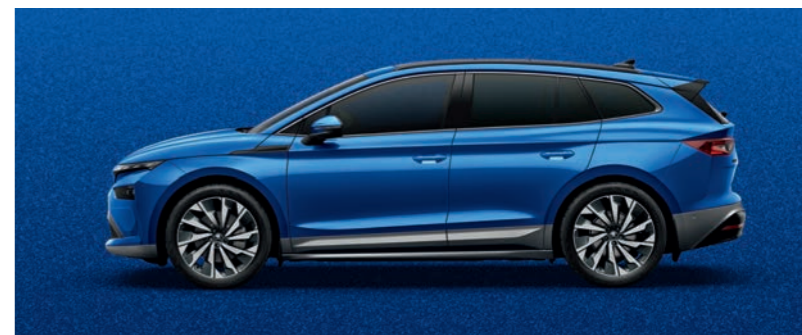
Race Blue metālika