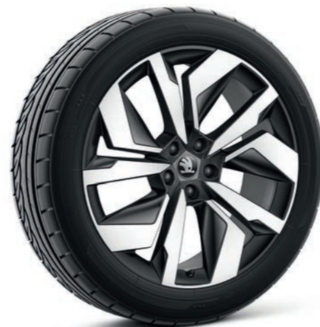
20" Vega melni vieglmetāla diski*