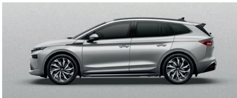
Brilliant Silver metālika