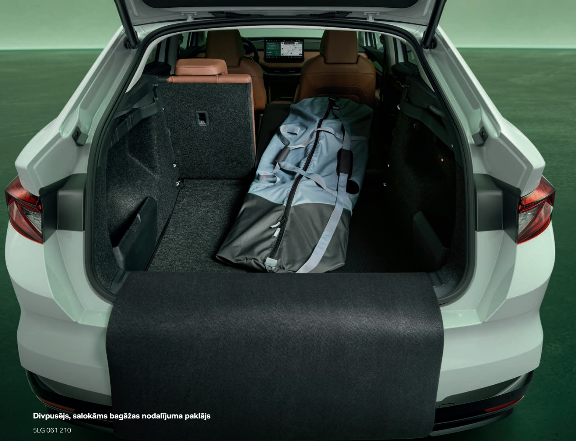
Divpusējs, salokāms bagāžas nodalījuma paklājs