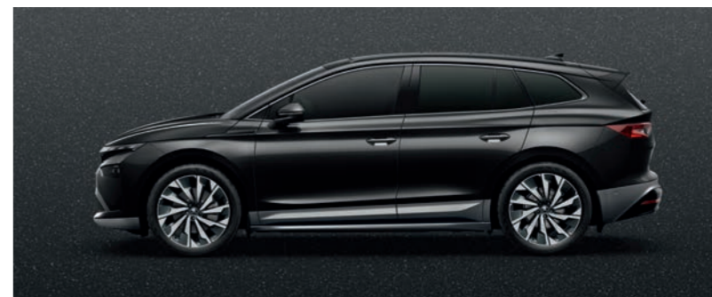
Black Magic metālika