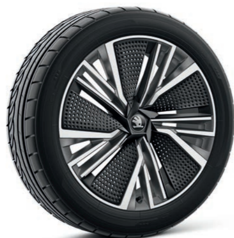
20" Neptune antracīta vieglmetāla diski ar melnām aero uzlikām