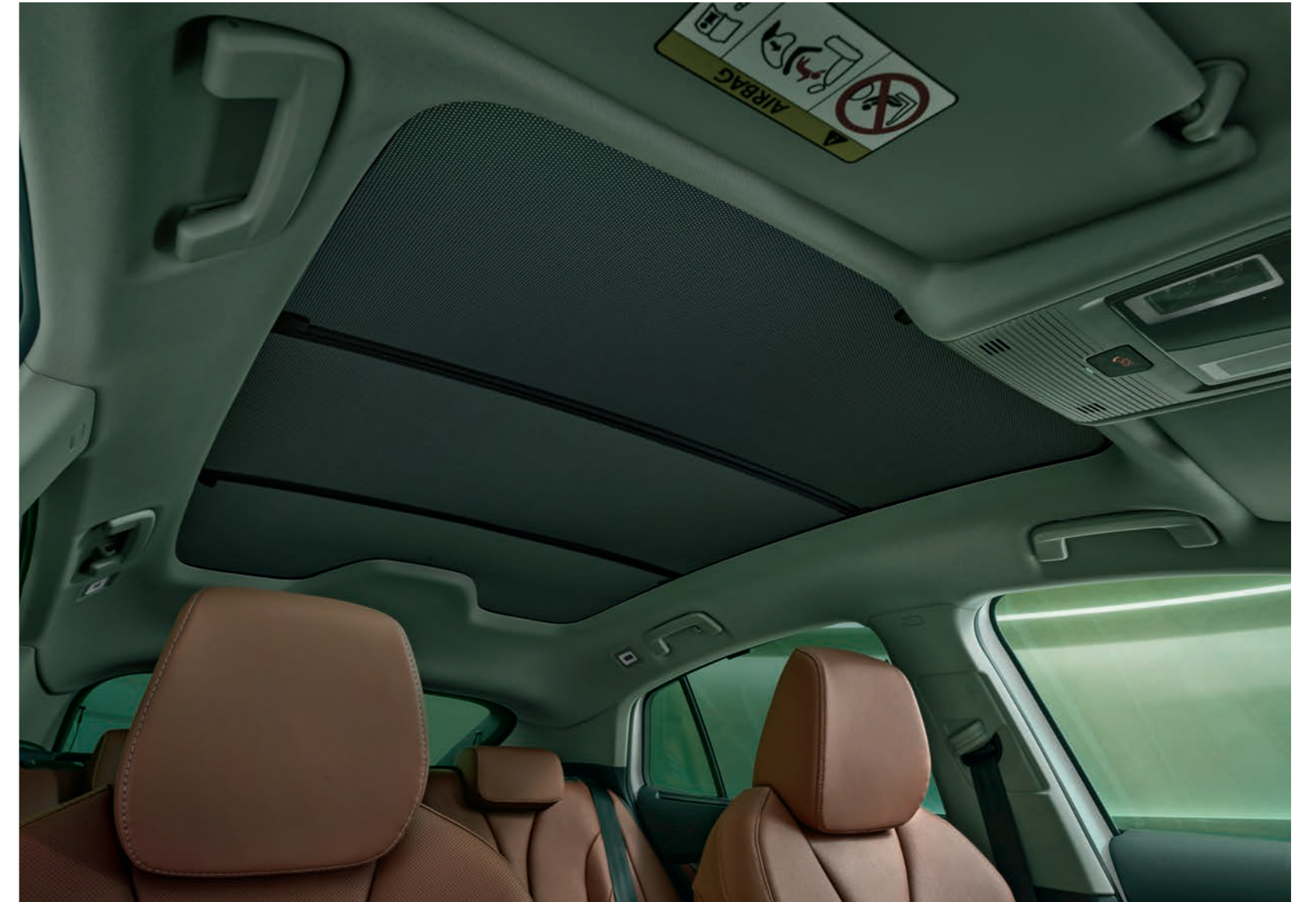
Saulesargs panorāmas lūkai