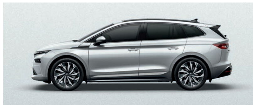
Moon White metālika