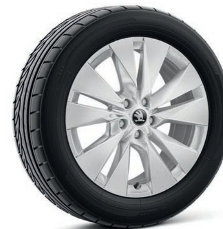
19" Proteus sudraba krāsas vieglmetāla diski